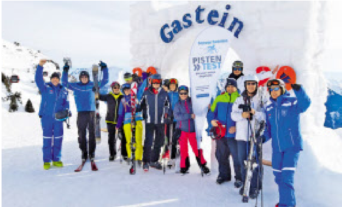
Die Teilnehmer des SN-Pistentests in Gastein waren gut gelaunt.