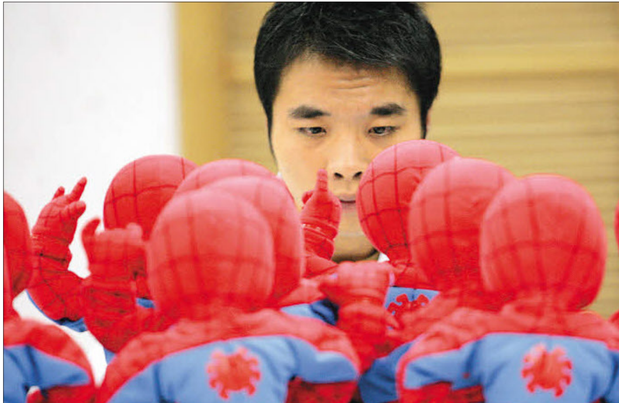
Teures Spielzeug lassen westliche Konzerne im Billiglohnland China fertigen. Vor Weihnachten greifen Eltern und Verwandte tiefer in die Taschen. Für Barbie oder Batman, die im Handel 20 Euro kosten, bekommt ein Arbeiter aber nicht einmal 20 Cent.

Deutschland € 1,20 - Italien € 1,70 Kroatien 14 KN - Slowenien € 1,70 P.b. Erscheinungsort Salzburg Verlagspostamt 5020 Salzburg 022031431T